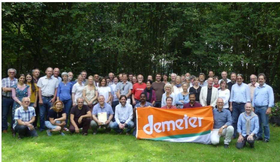
Demeter Internasjonal møttes i forbindelse med det internasjonale Biodynamiske Landbruksstevne i Dornach 2019.