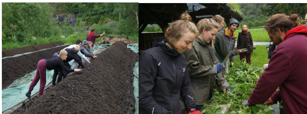
BINGN studenter in action

BINGN starter i 2023 det nye konseptet med å etablere et grunnår i Norge med hovedsete på Fokhol og Alm Østre. 9 Studenter skal starte den biodynamiske utdanningen nå.