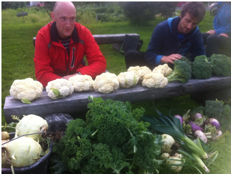
Fra Bodø Økologiske besøkshage

Koordinerer. Fordele oppgaver og utvikle samarbeid.